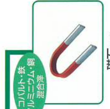
コバルト・鉄 アルミニウム・銅 混合滓