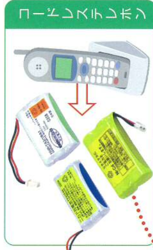
コードレスレホン