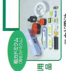
相対ミウム (再生カミカム)