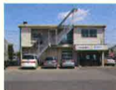
配車センター/本社営業所 (埼玉県久喜市)