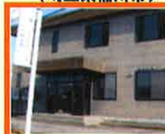
富士営業所 (静岡県裾野市)