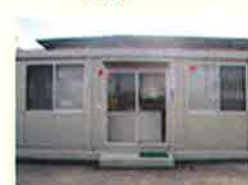
名古屋営業所 (愛知県小牧市)