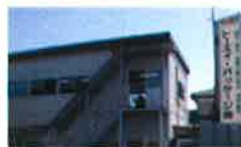
流通加工(化粧品等) トーエイ・パッケージ (埼玉県久喜市)