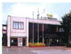
本社 (埼玉県久喜市)