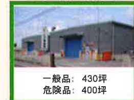
一般品:430坪 危険品:400坪