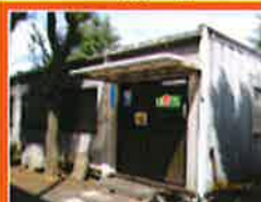
小山営業所 (栃木県小山市)