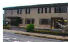
トーエイ・アドバンス (静岡県裾野市)