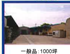
一般品:1000坪 蓮田物流センター (埼玉県蓮田市)