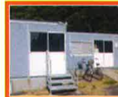
森野営業所 (神奈川県森野市)