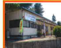
桶川営業所 (埼玉県桶川市)