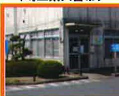
高蒲営業所 (埼玉県久喜市)