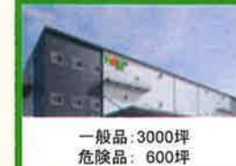
一般品:3000坪 危険品:600坪