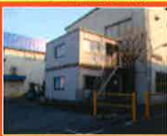
久喜営業所 (埼玉県久喜市)