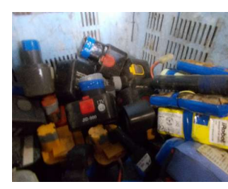
その他個別絶縁処理等